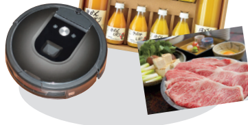
*過去のプレゼント例